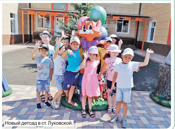
Новый детсад в ст. Луковской.